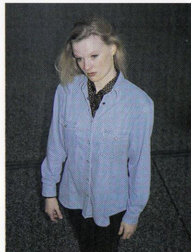
vogelperspectief (van hoog gefilmd) maakt klein, drukt neer

Kinderen filmen is meestal het mooist op ooghoogte van het kind